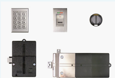
雷曼 e-solutions (电子密码、指纹识别、无线讯号)

控制您的家具像控制您开的德国汽车一样? 行政班台配置雷曼无线遥控锁后, 使用者能容易地使用无线遥控来开 / 关电子锁。无线电波的有效沟通距离直径远达十米。另外, 未经配对的电子锁不会受到任何其他无线电波指令干扰。